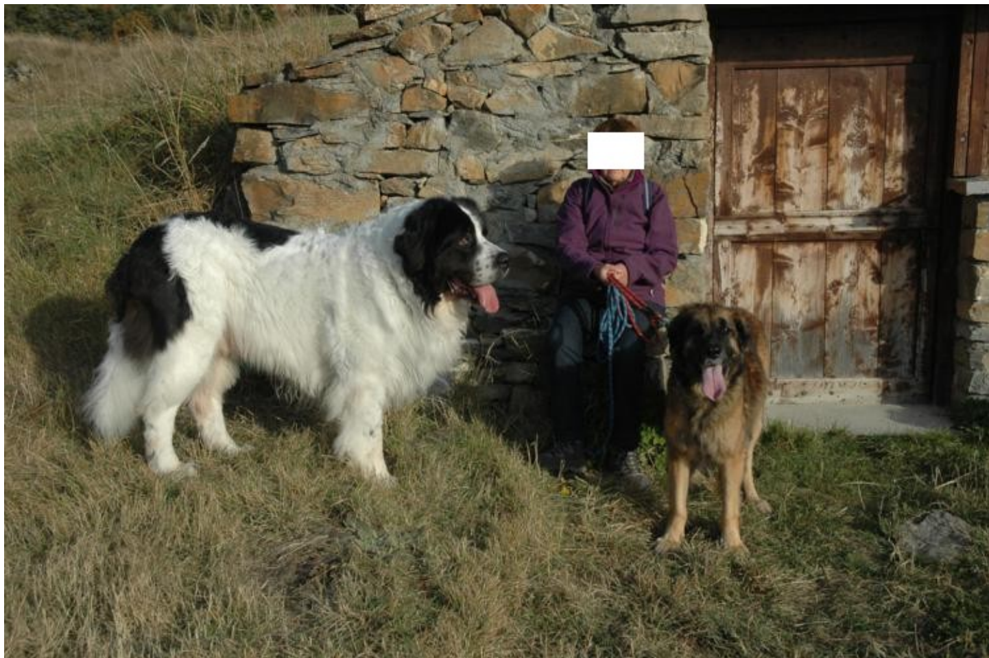
Illustration 1: Samba (Léonberg) et Bayou ( Landseer)