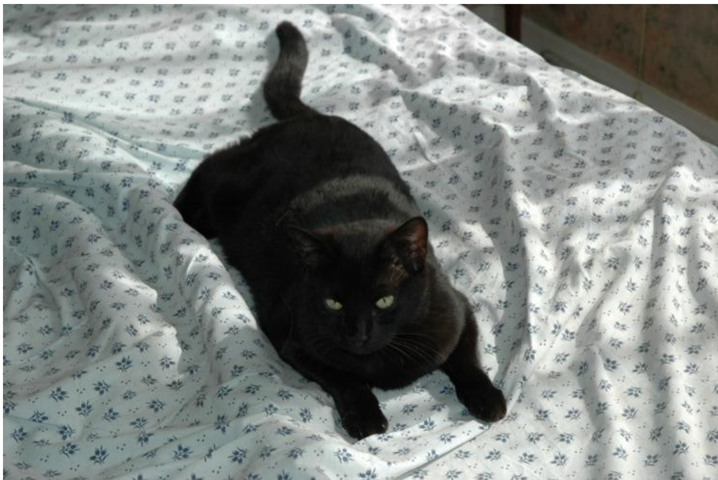
Illustration 7: Et Newton