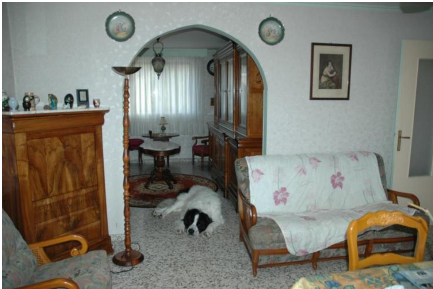
Illustration 5: Le salon