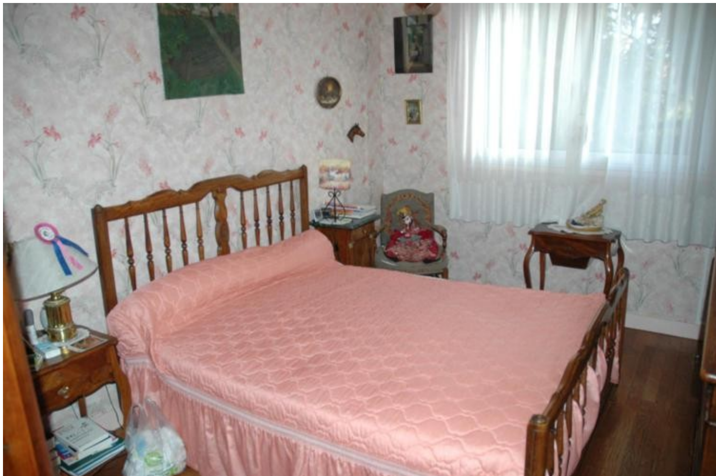
Illustration 6: La chambre d'ami