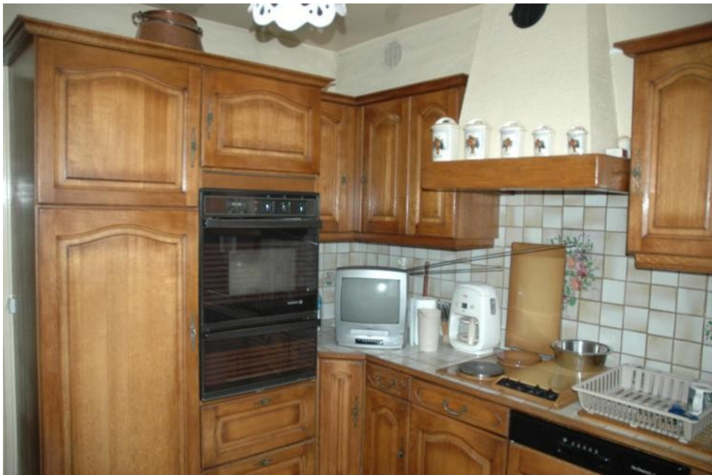
Illustration 4: La cuisine