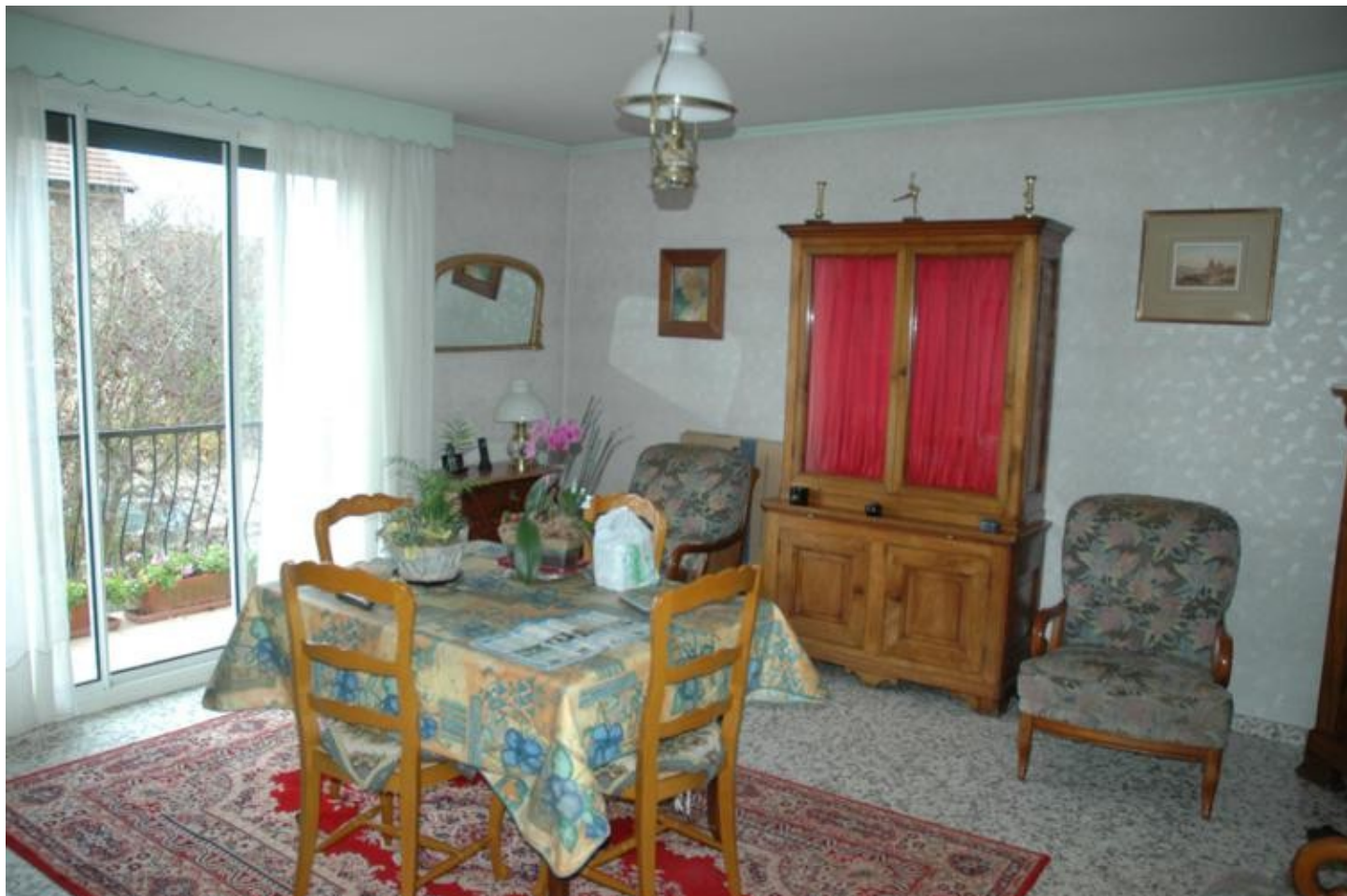
Illustration 3: La salle à manger