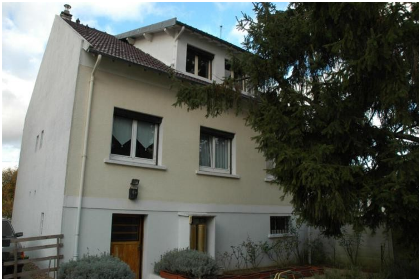
Illustration 2: Un pavillon de 90m 2 sur un terrain de 400m 2 dans un quartier calme et résidentiel