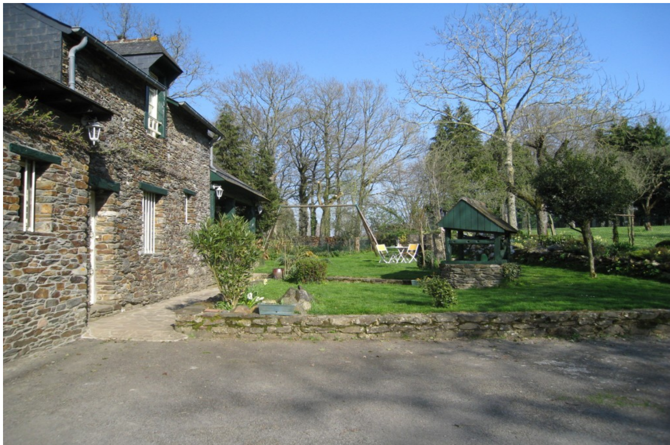
Illustration 2: La maison et son jardin