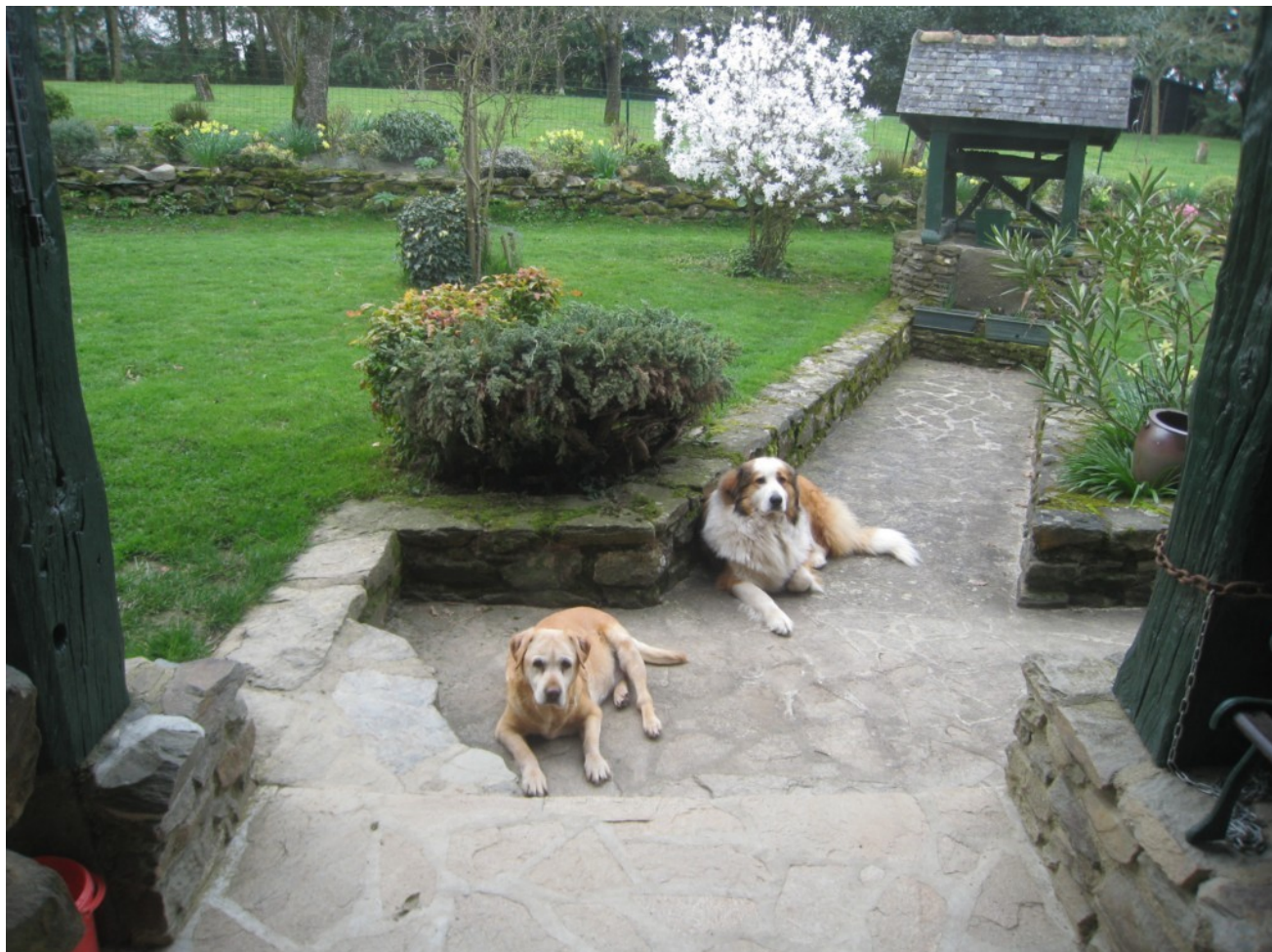
Illustration 1: Pistache et Ebène