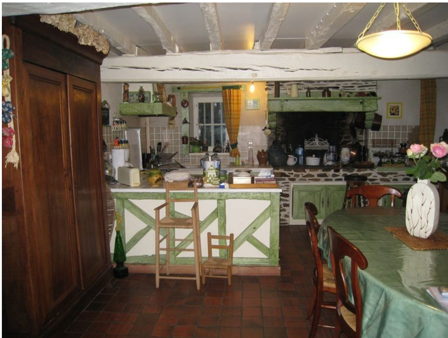
Illustration 6: La cuisine à l'Américaine et la salle à manger