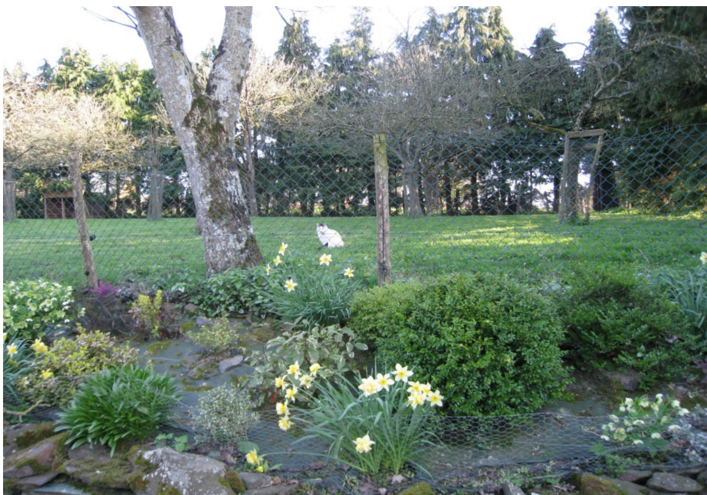
Illustration 3: Iris au second plan