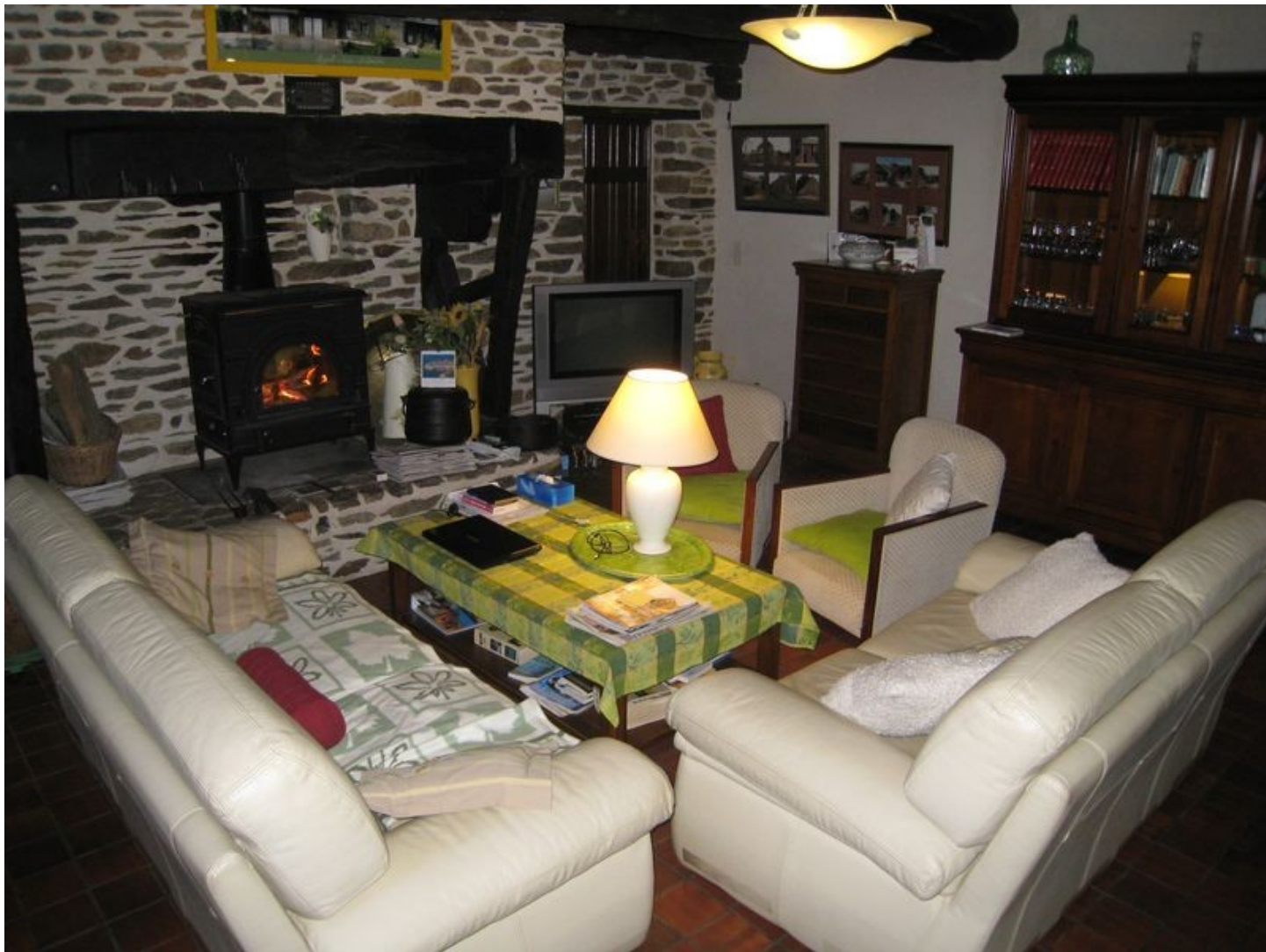
Illustration 5: Le salon