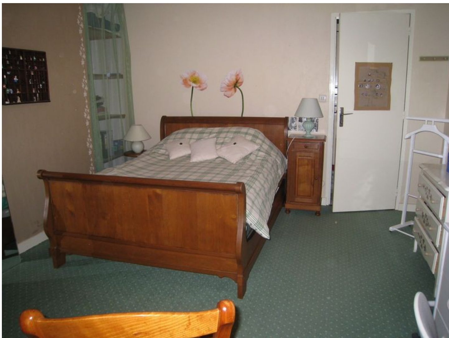
Illustration 7: La chambre d'ami