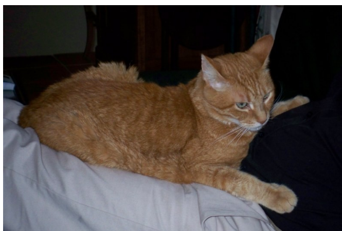
Illustration 2: CAMEL