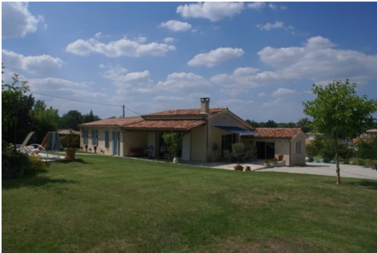
Illustration 4: Autre vue de la villa