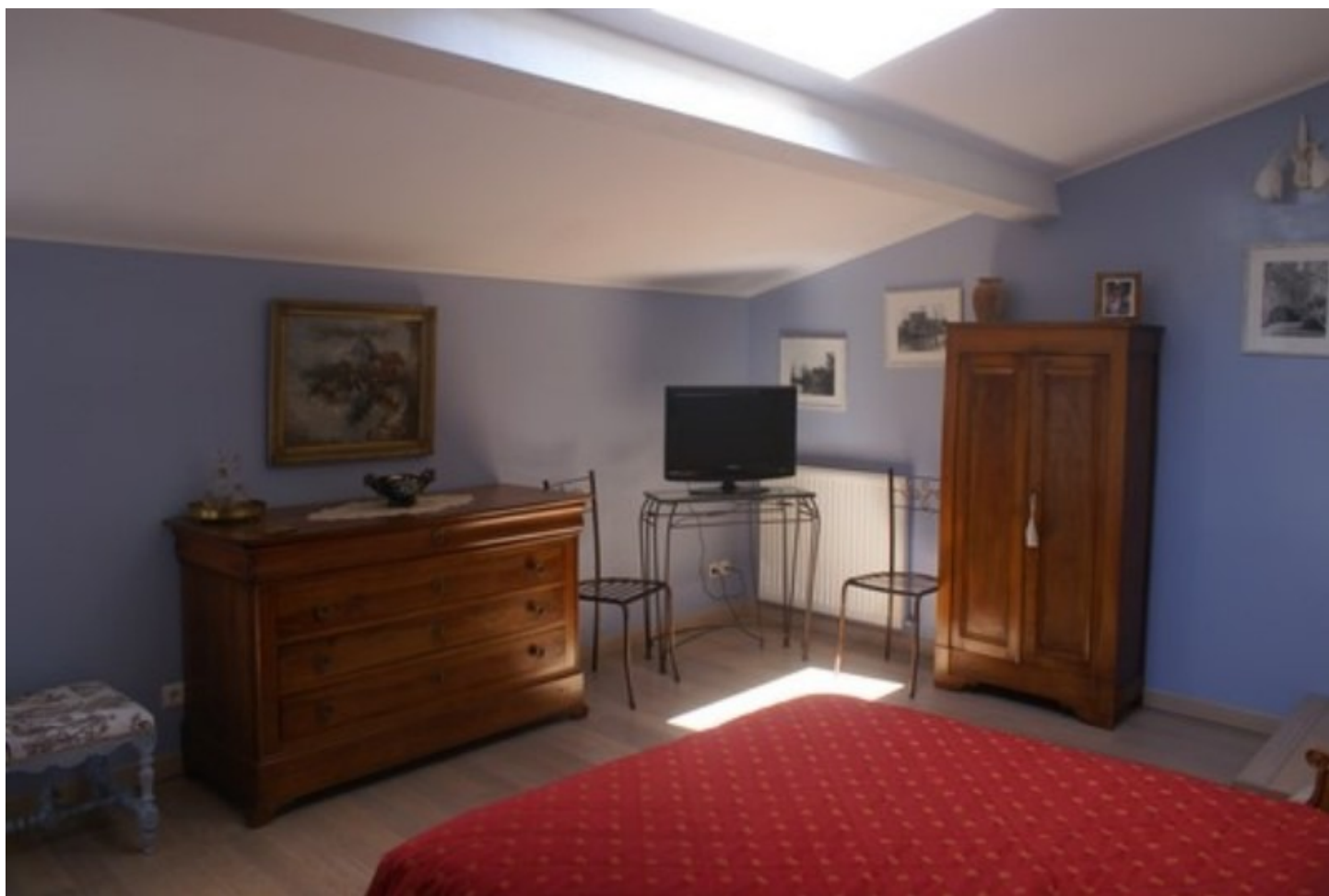
Illustration 6: La chambre d'ami