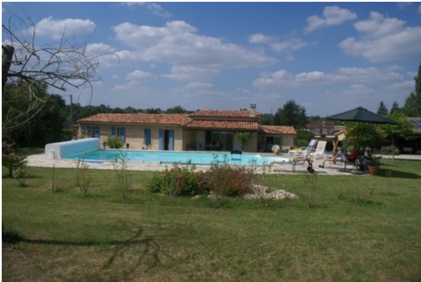
Illustration 3: Villa de 250 m2 avec piscine proche Bordeaux