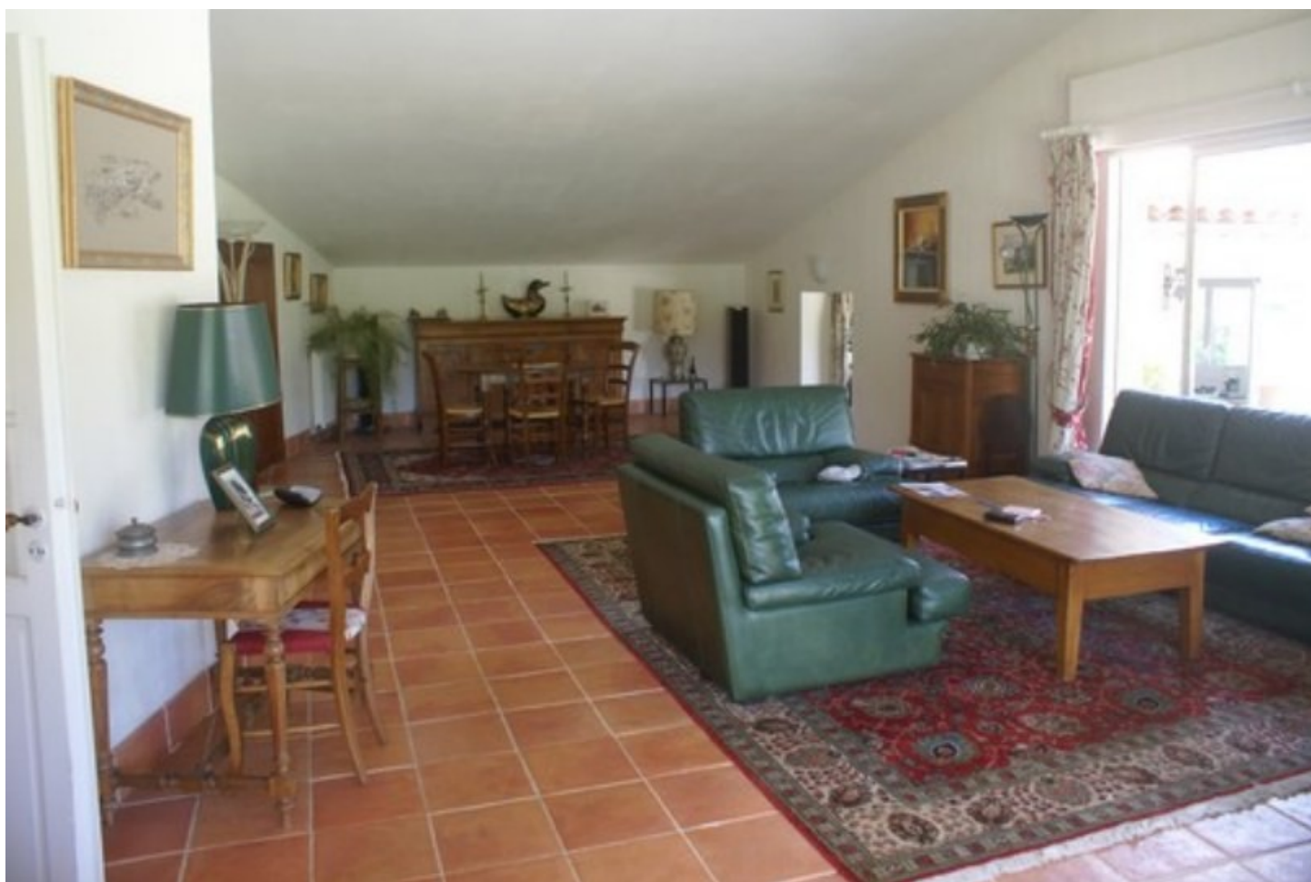
Illustration 5: Le salon - séjour