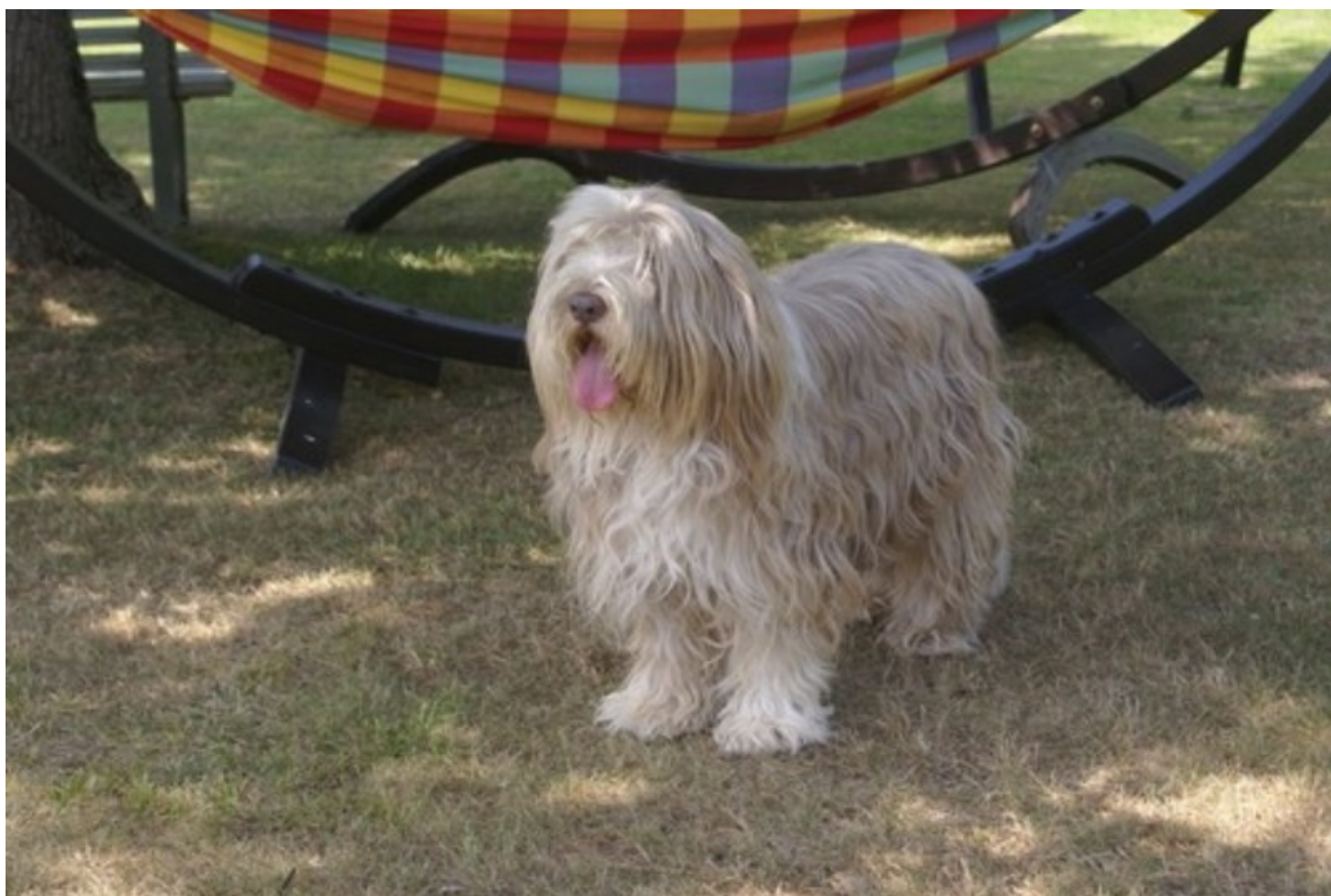
Illustration 1: RIPTON - Bearded colley