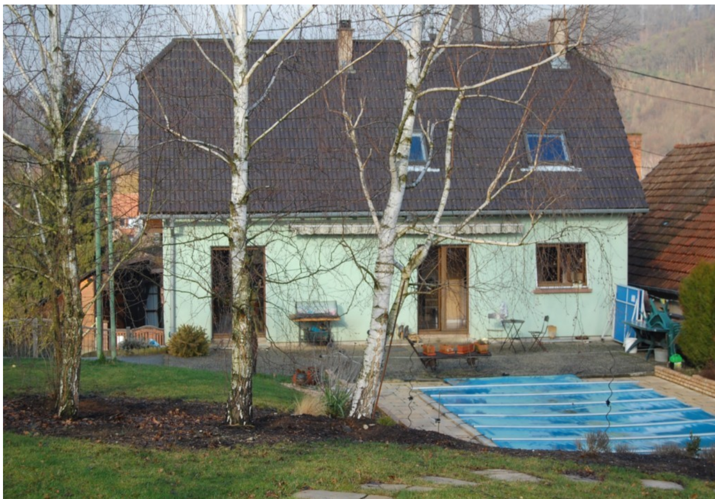
Illustration 1: La maison située dans le parc régional des Vosges, départ rando de la maison par sentier balisé.