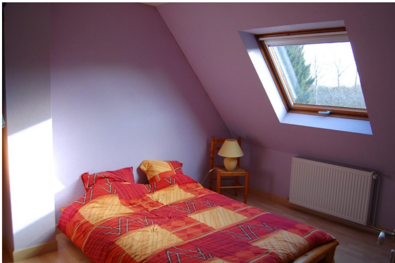
Illustration 8: La chambre d'ami