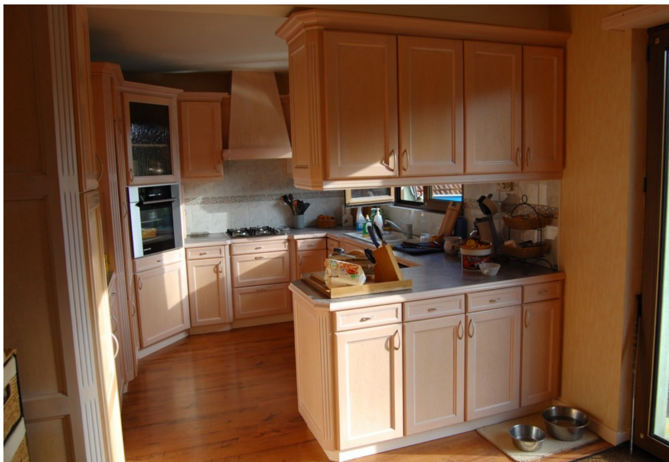
Illustration 6: La cuisine