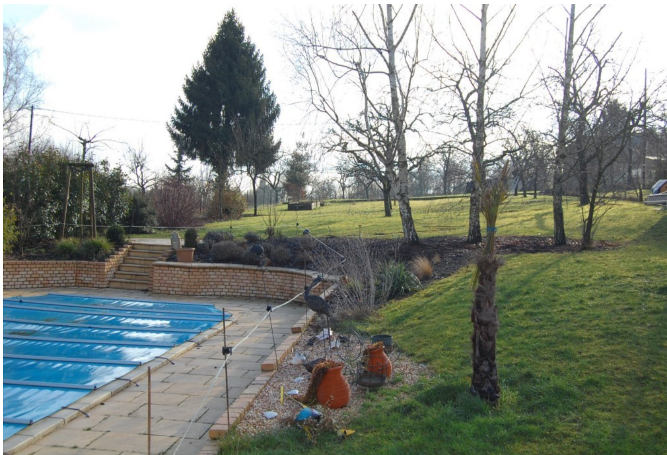
Illustration 9: Le jardin de 1800m2