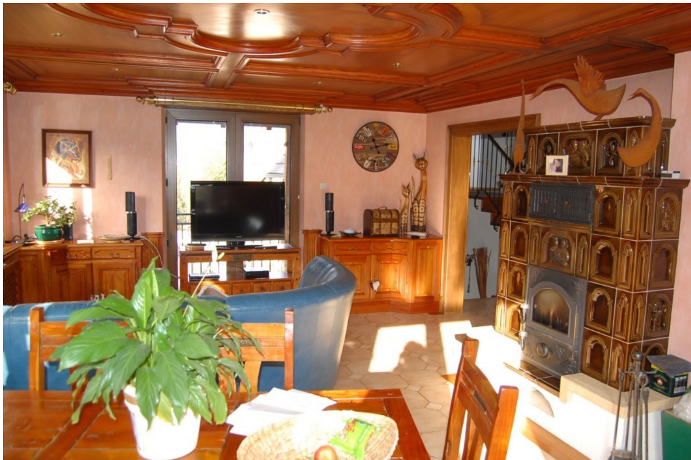
Illustration 7: Le salon, salle à manger