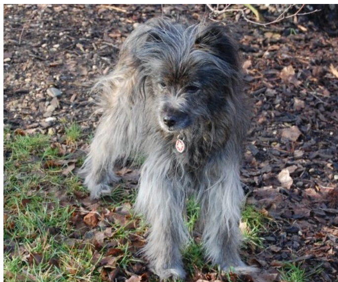
Illustration 4: Siona