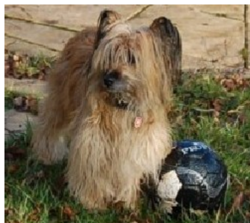
Illustration 5: Tess