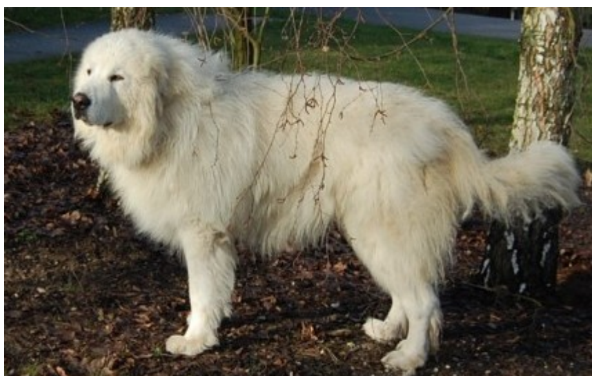
Illustration 3: Baou