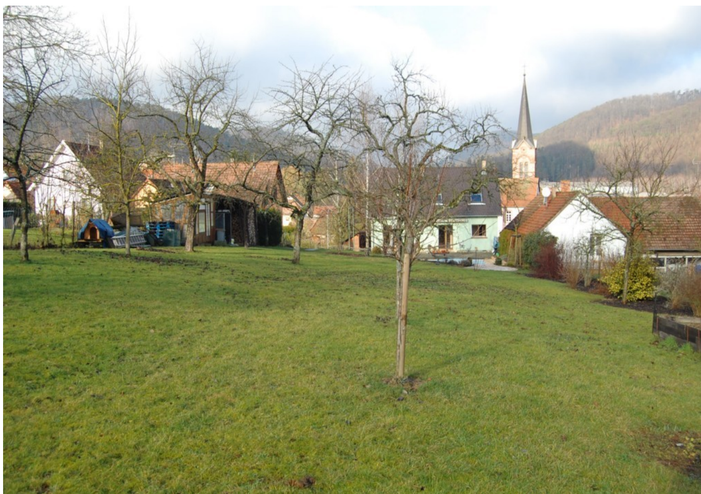
Illustration 2: Le village à proximité avec boulangerie , épicerie et restaurant